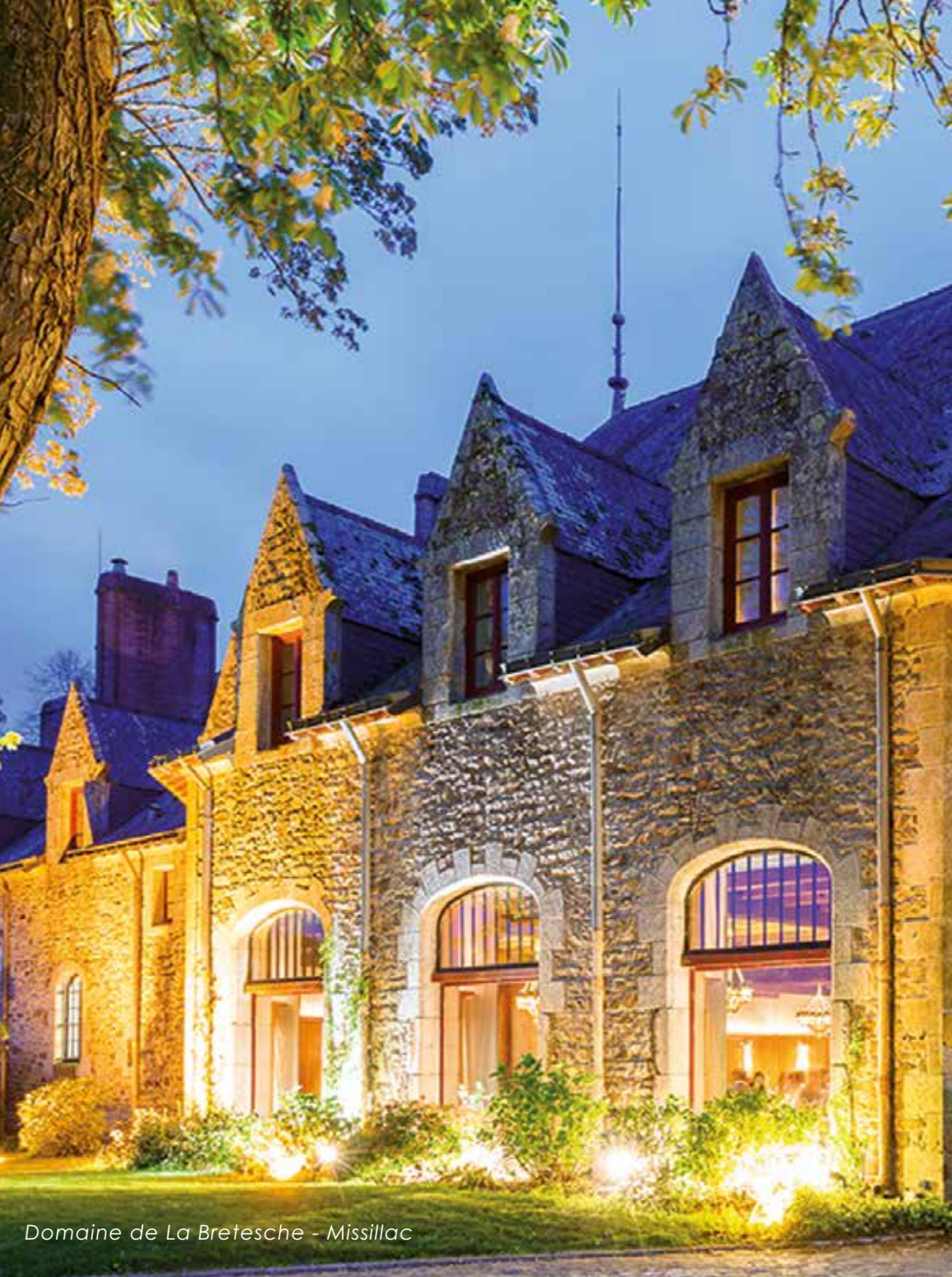
Domaine de La Bretesche - Missillac